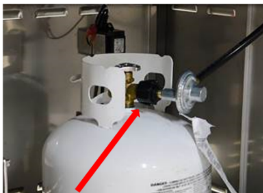
Regulator connected to propane tank.

Le numéro de modèle se trouve sur la plaque signalétique, sous le bac à graisse.